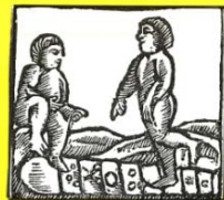
Loc de l'eixarranca, segons una acaia set-centista de jocs de la malaista.